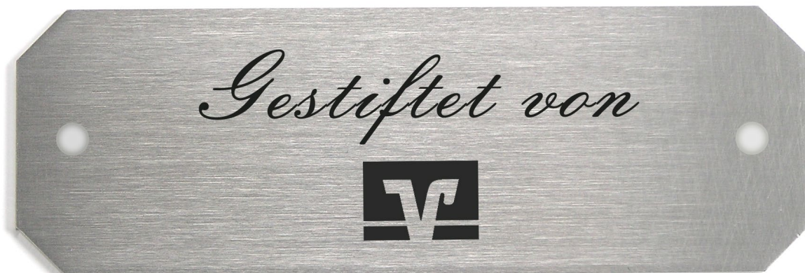
Abb. in Original- größe

Türschild achteckig, 150x50x3,0 mm, Best. Nr. ED-A-15050 Edelstahl V2A geschliffen, 240 Korn