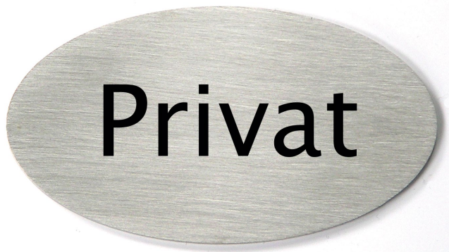
Türschild oval 85x45x1,5mm

Türschild Edelstahl geschliffen, oval, rückseitig selbstklebend