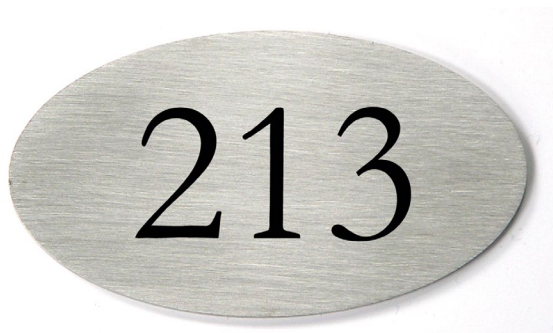
Türschild oval 67x37x1,5mm

Preis inkl. einer Textzeile Laserbeschriftung schwarz Mehrzeile Aufpreis 1,50 €