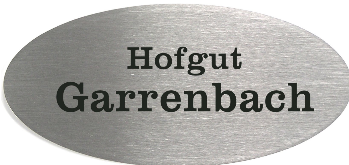
Abb. in Originalgröße

Türschild oval, 135x65x3,0 mm, Best. Nr. ED-O-13565 Edelstahl V2A geschliffen, 240 Korn